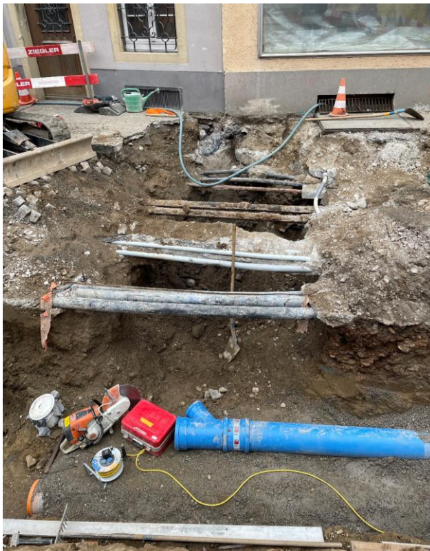
Marktgasse: Querschnitt bestehende Werkleitungen