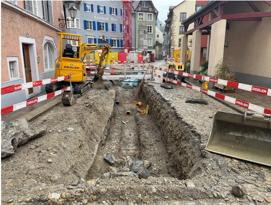
Aushubarbeiten für Entwässerung und Wasserversorgung