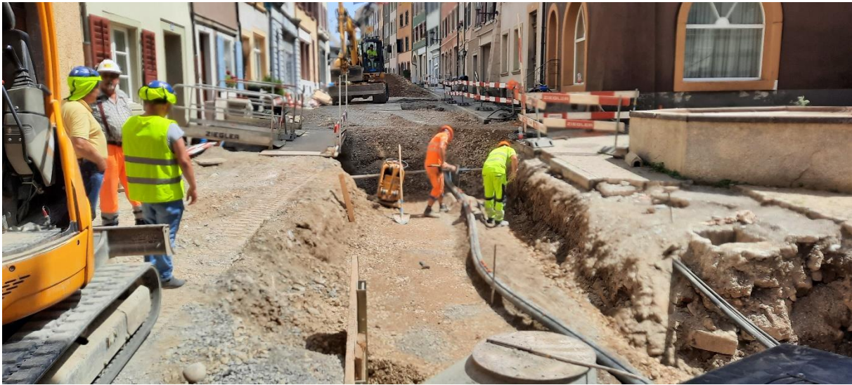
Verfüllen der Entwässerungsgräben