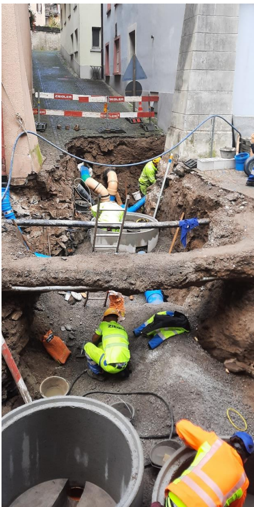
Setzen der Kontrollschächte 53 / D 53 im Bereich Flössergasse