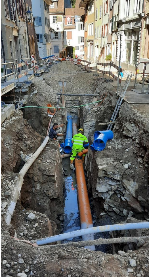
Verlegen der Hauptleitung