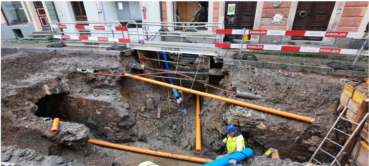
Graben im Bereich Flössergasse