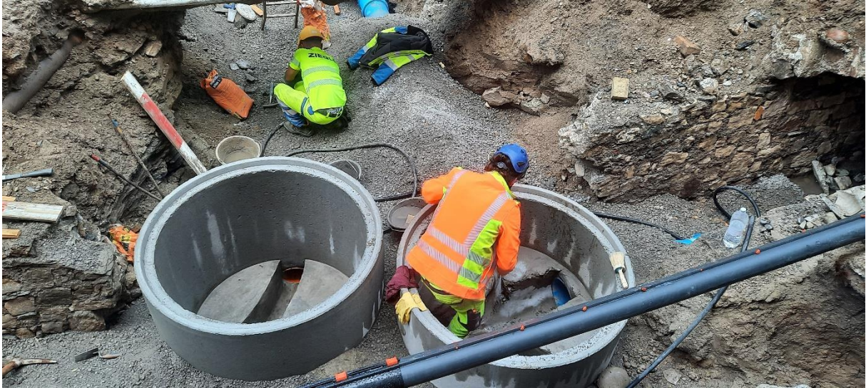
Setzen der Kontrollschächte 53 / D 53 im Bereich Flössergasse