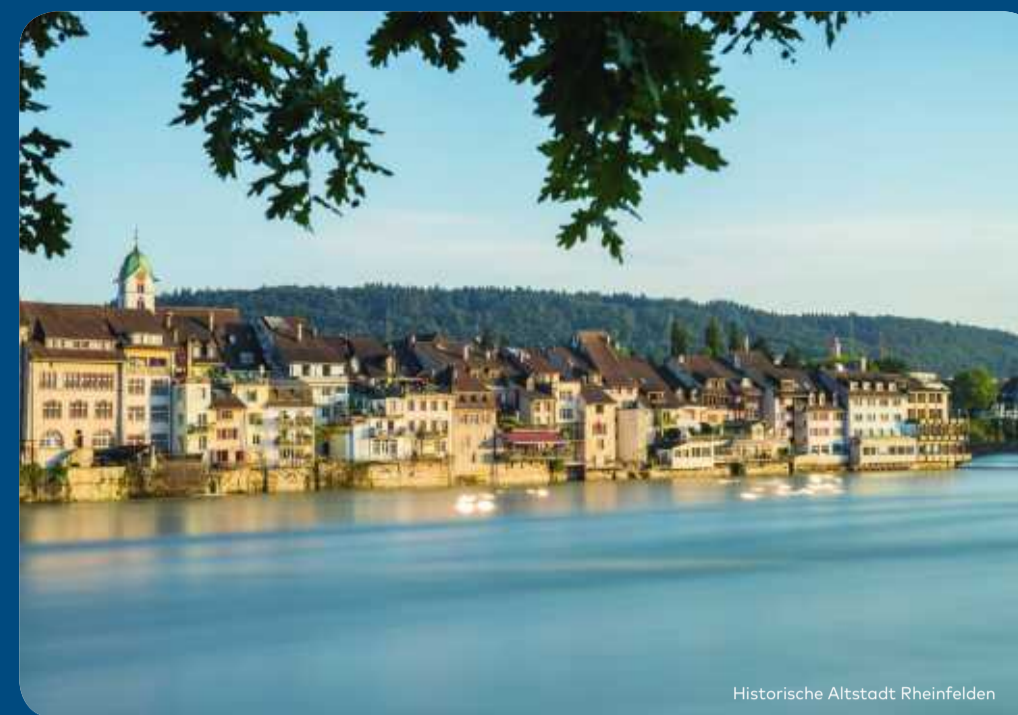
Historische Altstadt Rheinfelden